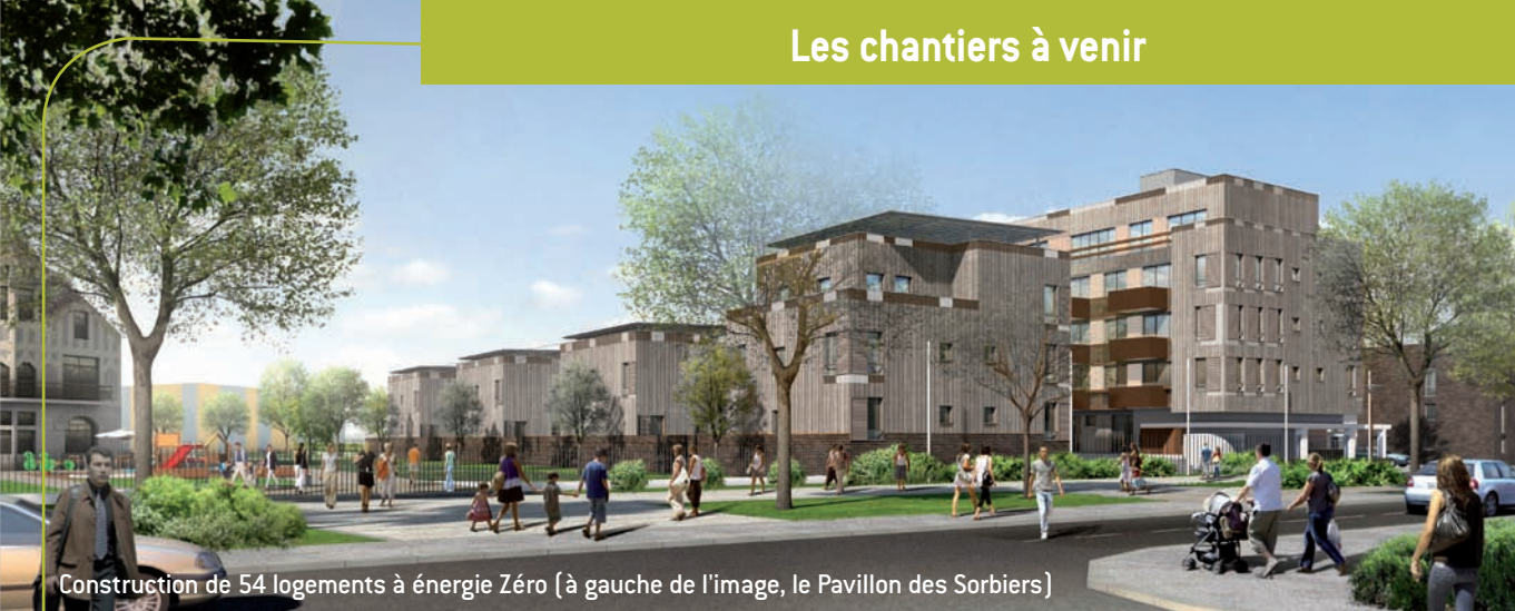
Construction de 54 logements à énergie Zéro (à gauche de l'image, le Pavillon des Sorbiers)