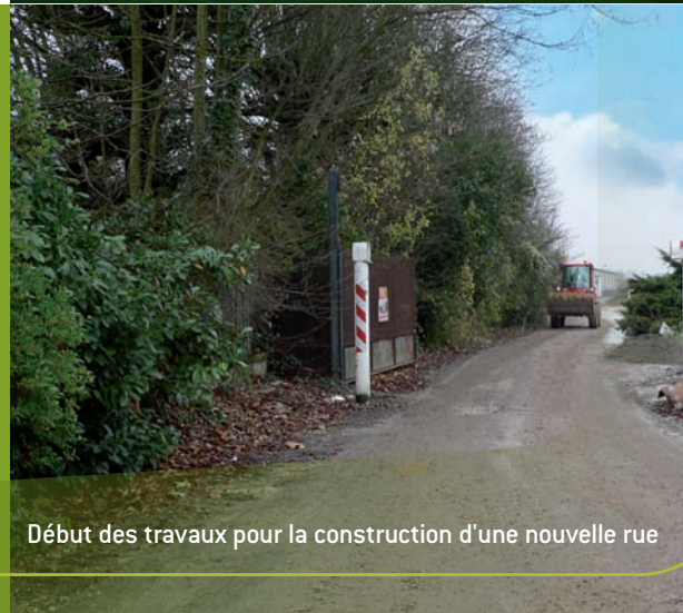
Début des travaux pour la construction d'une nouvelle rue

Elle permettra, à partir du Cours Lucien Clause, d'accéder au cœur du quartier et au parc de 7 hectares.