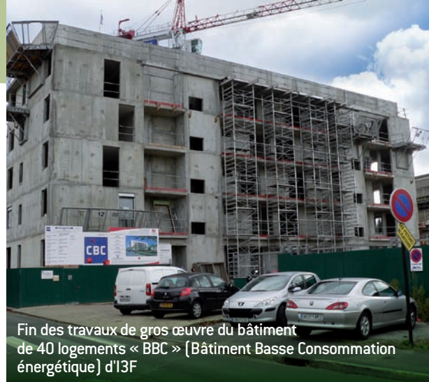
Fin des travaux de gros œuvre du bâtiment de 40 logements « BBC » (Bâtiment Basse Consommation énergétique) d'I3F

Les premiers habitants sont attendus à l'été 2011.