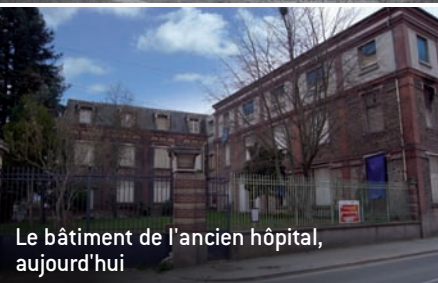
Le bâtiment de l'ancien hôpital, aujourd'hui

Face à la rue Pierre Brossolette, l'actuelle serre, aujourd'hui dédiée à la concertation, est entourée de deux bâtiments chargés d'histoire. Ils accueillirent dès 1899 les activités administratives de l'entreprise Clause. C'est au cours de la première guerre mondiale qu'une partie de ces locaux fut aménagée en hôpital solidaire en arrière du front.