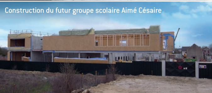
La ferme réhabilitée accueillera le futur groupe scolaire Aimé Césaire

La ferme du Mesnil, véritable patrimoine agricole du site, fut d'abord la propriété de Paul Gabriel Chevrier, inventeur du procédé de conservation permettant aux haricots secs de garder leur couleur verte.