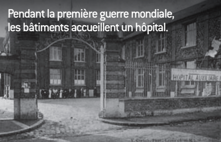
Pendant la première guerre mondiale, les bâtiments accueillent un hôpital.