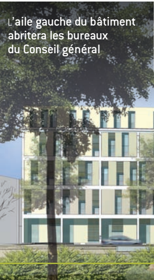
L'aile gauche du bâtiment abritera les bureaux du Conseil général