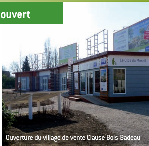
Ouverture du village de vente Clause Bois-Badeau

BNP/Vinci, Sefri Cime et Ouest Immo ont lancé leur commercialisation fin mars. Les promoteurs sont à votre disposition pour vous informer sur les 330 logements proposés à la vente autour du parc.