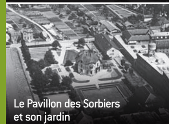
Le Pavillon des Sorbiers et son jardin