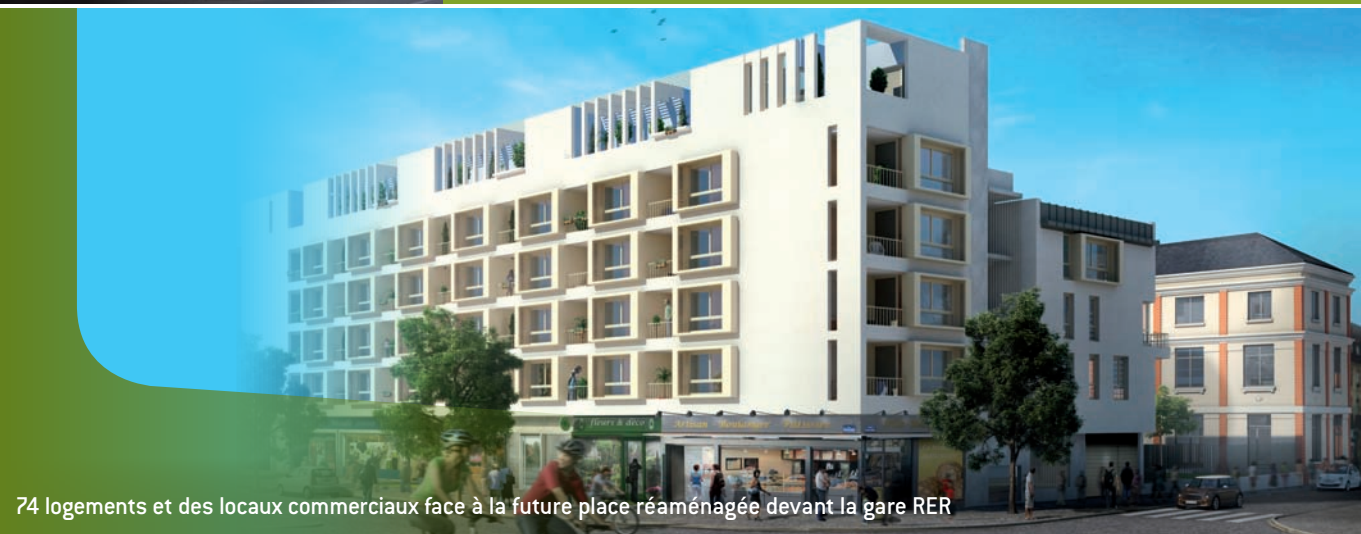
74 logements et des locaux commerciaux face à la future place réaménagée devant la gare RER

Le programme sera complété par la construction de 56 logements neufs et de locaux commerciaux face à la future place réaménagée devant la gare RER.