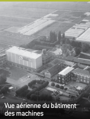
Vue aérienne du bâtiment des machines